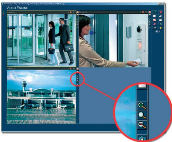
Рис. 2: Функция цифрового увеличения изображений с каждой камеры