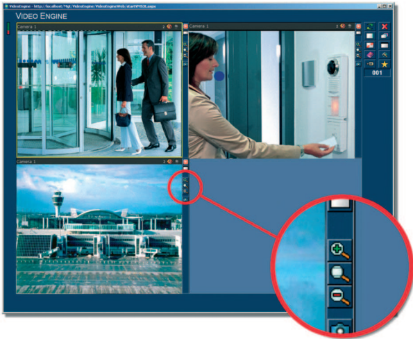
Fig. 2: Funzione zoom digitale per ogni immagine della telecamera