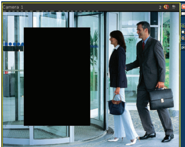
Fig. 3: Area mascherata dalla funzione zone privacy